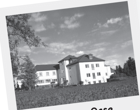
Gästehaus Oase Neustadt-Lachen