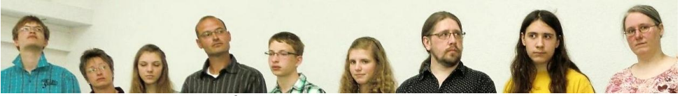
Mitgliederaufnahme in der Stadtmission am 29. Mai