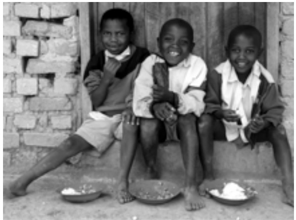
Kinder vor einer Hütte in Uganda

Schon mit 30 Euro im Monat, kann ein Patenkind in Uganda jeden Tag satt werden, in die Schule gehen und liebevoll versorgt werden.